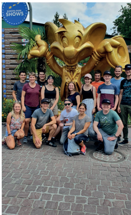
Gruppenfoto Ausflug Europa-Park

Nach einem langen Tag, an dem einige LeiterInnen von uns bei der mehrfachen Benutzung der Silverstar fast ihre Gesundheit vergassen, kehrten wir alle mit einem grossen Lächeln in die Schweiz zurück.