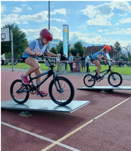
Auf zwei Rädern schnell unterwegs