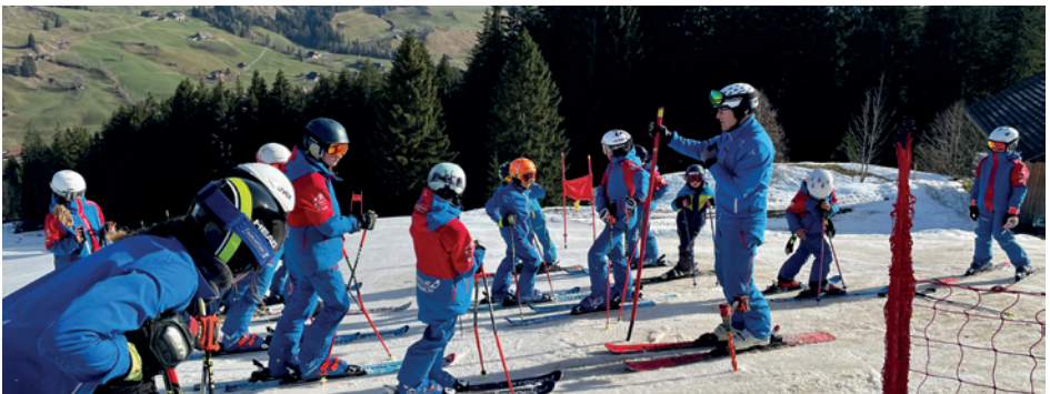
Besichtigung Trainingslauf im Bumbach