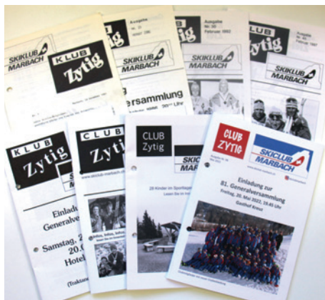
Einige Club-Zytigen der Vergangenheit

wird und die Jahresberichte in Zukunft auf der Homepage nachzulesen sind, wird sich in den kommenden Wochen nach euren Reaktionen zeigen. Somit wäre diese Club-Zytig Ausgabe Nr. 99 nach 43 Jahren die letzte Club-Zytig in gedruckter Form gewesen?