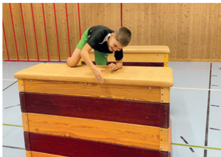
Hindernislauf, jährlich eine Challenge