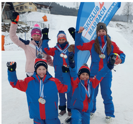
MedaillengewinnerInnen an unserem Rennweekend