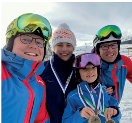
Drei Medaillen am Kinderskirennen im Sörenberg