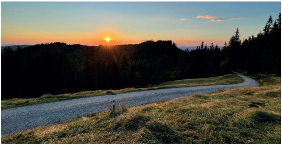
Sonnenuntergang - ohne Worte

... Deshalb muss die Planung für die kommende Saison jeweils bereits im Spätherbst gemacht werden.