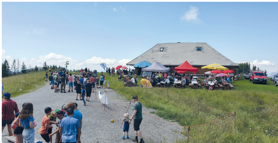
Viele Besucher am Hürnli-Bärgfest