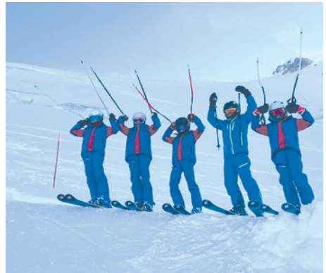
Teil der Renngruppe auf dem Titlis