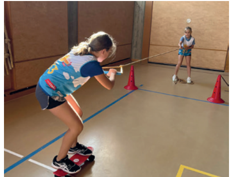
Viel Balance ist gefragt

Dieses Jahr nahmen wir mit einer Gruppe der Kategorie Juniors sowie mit zwei Teams der Kategorie Youngsters an der SwissPass Smile Challenge in Thun teil. Die verschiedenen Posten erforderten nicht nur individuelle Leistungen, sondern vor allem einen starken Teamgeist. Obwohl kein Team unserer sehr jungen Gruppen den Finaleinzug schaffte, hatten alle JO-Kinder viel Spass bei diesem polysportiven Anlass.