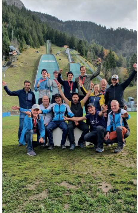
Das OK der Schweizermeisterschaften mit dem ZSSV-Silberteam

Den richtigen Zeitpunkt erwischt haben wir auch bei unserem Clubtreff auf dem Eisfeld Marbach. Als die Temperaturen kalt genug waren, konnten wir endlich den jahrelang geplanten und immer wieder verschobenen Clubtreff auf dem