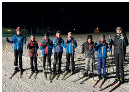
Spezialtraining auf den Langlaufski