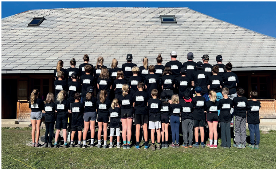
Gruppenfoto mit dem Jubiläums T-Shirt