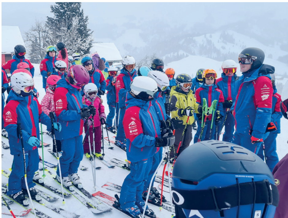
Erstes Training auf der Marbachegg