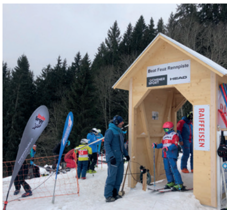
Start am Berger Sport Kombi-Race im Bumbach