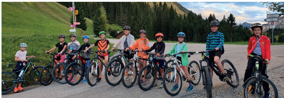
Gruppenfoto Biketour Donnerstagtraining

Für die Renngruppe und interessierte Kinder fand das Donnerstagtraining das ganze Jahr über statt. In diesen eineinhalb Stunden wurde gezielt an wichtigen Punkten wie Schnellkraft, Ausdauer und Balance gearbeitet. Daneben kamen auch oft das Bike, die Langlaufski oder der Schlitten zum Einsatz.