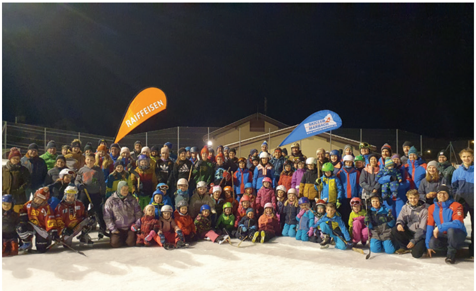
Alle TeilnehmerInnen beim Clubtreffen auf dem Eisfeld Marbach

Ob der Skiclub Marbach das Netzwerk mit den Sozialen Medien intensiver nutzen