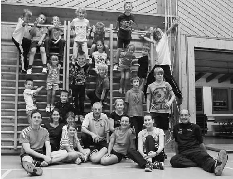
Das Langlauf-Team im Dienstagabend-Training

Erstmalig erfolgte ein mit den Alpinen einheitliches «offizielles Einschreiben». Und dann ging's gleich los mit dem vielseitigen Sommertraining. Am Dienstagabend durften wir im Schnitt ca. 20 Jugendliche zum Training begrüßen. Den Älteren boten wir auch am Mittwochnachmittag und am Samstagvormittag Trainingseinheiten an.