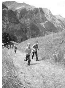
Yanick und Janis beim Crosslauf