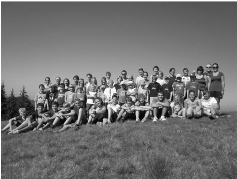
TeilnehmerInnen und LeiterInnen Hürnilager 2011

Dieses Jahr trafen sich die JO Kinder am 1. Oktober zum 39. Hürnilager. Bei schönstem Wetter verbrachten wir eine tolle Woche. Am Samstag erreichten wir zu Fuss oder mit dem Bike die Hürnilihütte. Eröffnet wurde das Lager mit dem beliebten Baseball, das allen immer sehr viel Spass macht. Später konnten die Kinder den Schlafsaal in der Hütte beziehen und einrichten.