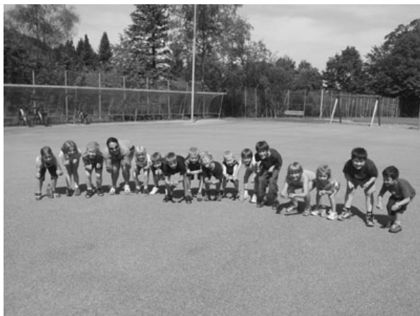
Jüngere Trainingsgruppe beim ersten Samstagstraining

Am Hürnli-Bergfest wurde mit der JO-Cup-Rankverkündigung die letzte Saison beendet. Neu wird der JO-Abschluss Alpin und Nordisch jedes zweite Jahr am Hürnli-Bergfest statt finden. Gleichzeitig wurde damit der Startschuss in die nächste Saison gesetzt. Motiviert sind Kinder und Leiter nach den Sommerferien wieder in die Samstagstrainings eingestiegen. Es wird an der Kondition und Koordination gefeilt, sodass die Schweissperlen auf der Stirn glänzen und der Muskelkater am nächsten Tag etwas schmerzt. Die Kinder sind in eine jüngere und eine ältere Trainingsgruppe eingeteilt. Der Crosslauf und der Hindernislauf wurden jeweils in einem Samstagstraining absolviert. Beide Wettkämpfe sind Teil des JO-Cups, wo die Kinder schon erste Punkte sammeln und sich eventuell eine günstige Ausgangslage für die Winter-Wettkämpfe ersprinten konnten. Zusätzlich wurde dieses Jahr auch der Jojuba-Test für den JO-Cup gewertet. Jojuba steht für jonglieren, jump oder Seil springen und balancieren. Insgesamt wurden dabei die Fertigkeiten in verschiedenen Koordinationsübungen getestet.