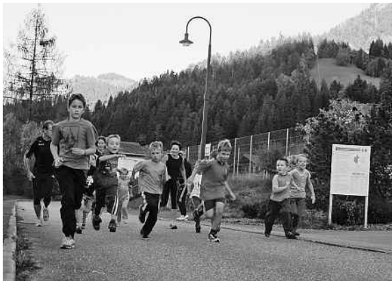
Achtung, fertig, los... Start zum Kilometer-Testlauf